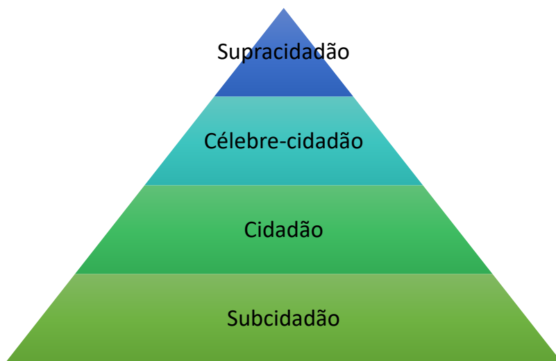
Figura 1 - Pirâmide da Cidadania Midiática

Anteriormente propusemos (CIRINO e TUZZO, 2016) uma graduação hierárquica da cidadania midiática na sociedade contemporânea, visando organizar as formas amalgamadas de menção dos veículos de imprensa mais comuns, ao visualizarmos as formas como os discursos são concebidos, com interferências na formação da opinião pública e na construção da representação social da cidadania (TUZZO e BRAGA, 2009), e que configuram lugares marcadamente distintos para os seres humanos; bem como foram consideradas as reflexões teóricas de autores como Marshall (1967); Souza (2012); Tuzzo (2014); Figueiredo e Tuzzo (2011) e Sodr  (2021); para a construção de cada uma das camadas da pirâmide da cidadania midiática: