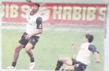
Washington é esperança de gols do São Paulo, no Serra Dourada

Pela terceira vez nos últimos cinco anos, o Goiás está no centro das definições do Brasileiro. Como coadjuvante, esmeraldino encara São Paulo no Serra Dourada, que luta pelo tetra. Páginas 8 e 9